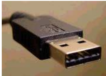
Figura 1 – Receptáculo tipo A

A porta USB é um meio pelo qual o microcontrolador ou PC podem utilizar para se comunicar com o mundo externo. Existem basicamente dois tipos de conectores USB, que são chamados de receptáculos onde o do tipo A pode ser visualizado na figura 1 e o do tipo B na figura 2.