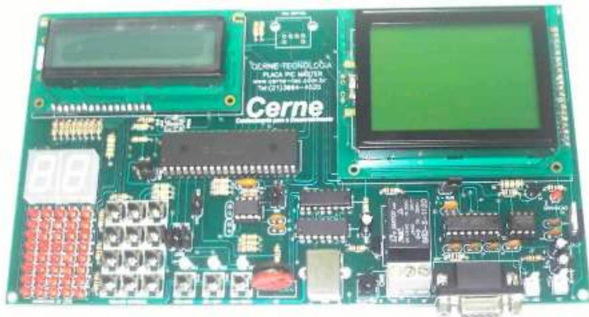
Figura 5 – Placa PIC MASTER da Cerne Tecnologia

Com esta placa, além do protocolo USB, verifique o que você poderá aprender: