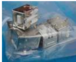
Figura 2 – Receptáculo tipo B

Neste conector, encontramos quatro pinos onde a função de dois deles é alimentar algum dispositivo externo e os outros dois para fazer a comunicação USB. Observe este detalhe na figura 3.